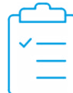
Kalibrierzertifikat mit Akkreditierung