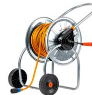
Kabel 50 m / 75 m / 100 m zur Messung niederohmiger Widerstände und zur Prüfung des Blitzschutzes von Windkraftanlagen

WAADAPRZ050BDP WAADAPRZ075BDP WAADAPRZ100BDP