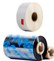
Tape / (klebend)