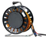
Kabel 25 m zur Messung niederohmiger Widerstände und zur Prüfung des Blitzschutzes von Windkraftanlagen