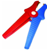
2 x Kelvinklemme 1 kV 25 A