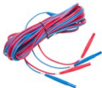
Doppeldraht-Prüfleitung (10 / 25 A) U1/ I1 6 m / 10 m / 15 m

WAPRZ006DZBBU111 WAPRZ010DZBBU111 WAPRZ015DZBBU111