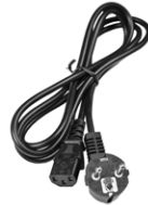
Kabel zur Versorgung und zum Laden von Akkus (IEC C13)