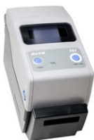
Protokoll-/ Barcode drucker (USB, tragbar)

WAADAPRZ050BDP WAADAPRZ075BDP WAADAPRZ100BDP