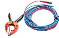
Doppeldraht-Prüfleitung 10 m mit Kelvinklemme

WAPRZ006DZBBU2I2 WAPRZ010DZBBU2I2 WAPRZ015DZBBU2I2